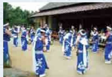
● 8月15日(水) 13:30ころ じゃんがら念仏踊 (郷ヶ丘じゃんがら会)