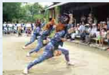
● 9月17日(月・祝) 13:00ころ 三匹獅子舞 (絹谷獅子舞保存会)