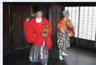
● 1月14日(月・祝) 14:00ころ 会津万歳 (安佐野万歳保存会 会津支部)