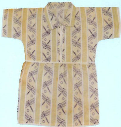
子ども用シャツ (昭和19~20年)